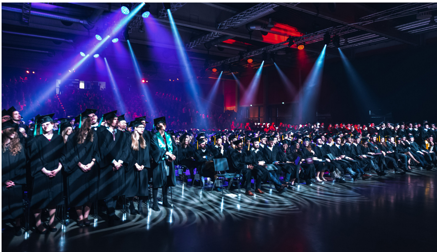
Über 400 Alumni - in traditionellem Gewand - wurden von der THD verabschiedet.