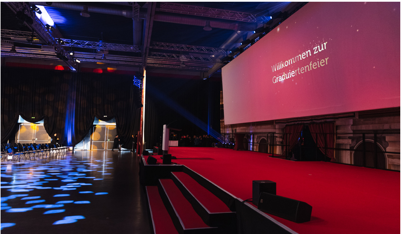
Vor der Show beeindruckte bereits das Design, das unter dem Motto „Hollywood-Gala“ stand.