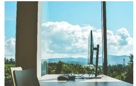
Abbildung 2: Arbeitsplatz am TCH